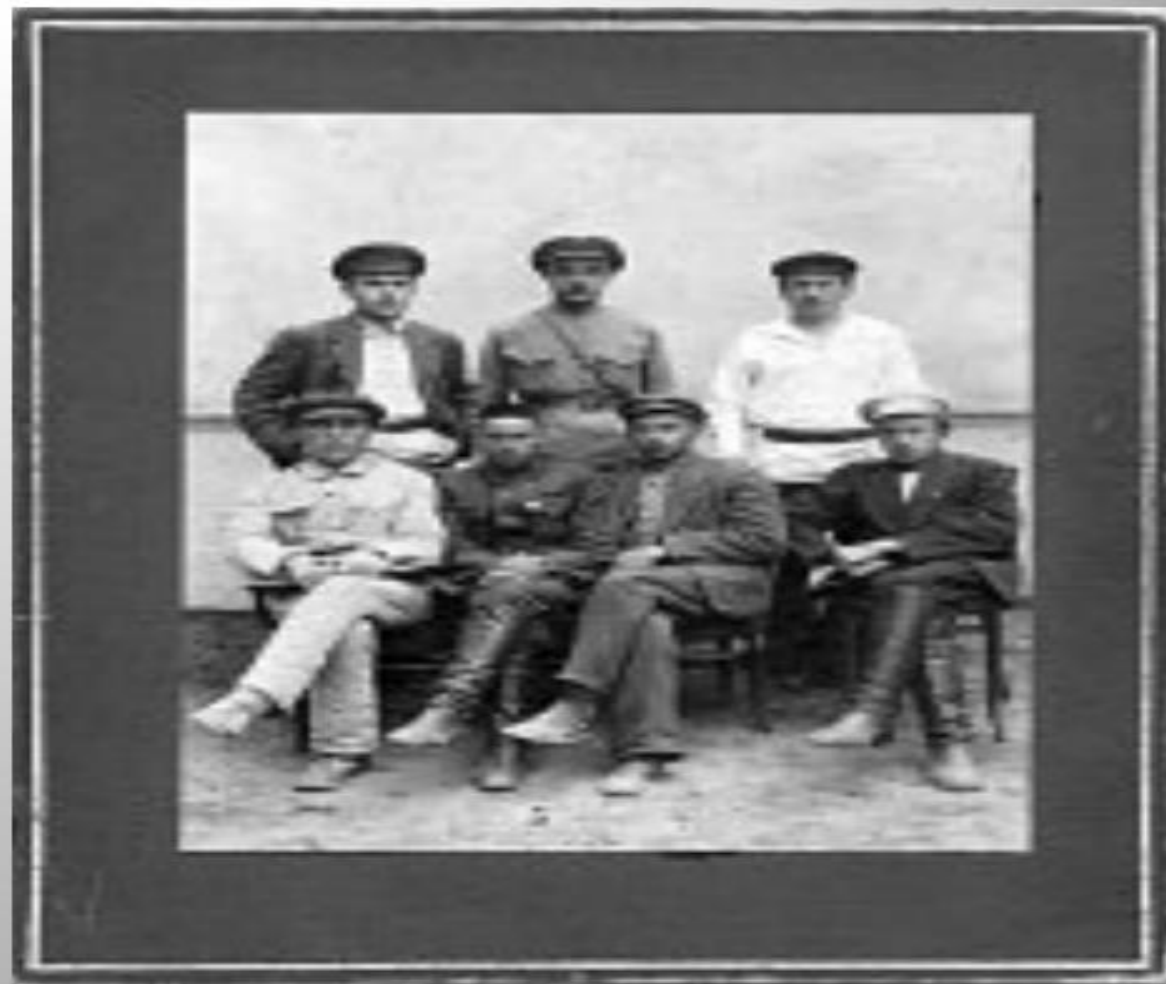
Президиум Тат Цика 1го созыва 1920 г.

Высшим органом государственной власти в пределах ее Территории являлся Съезд Советов ТАССР, а в период между съездами – избираемый им Центральный Исполнительный Комитет с избираемым, в свою очередь, исполнительным органом – Советом Народных Комиссаров.