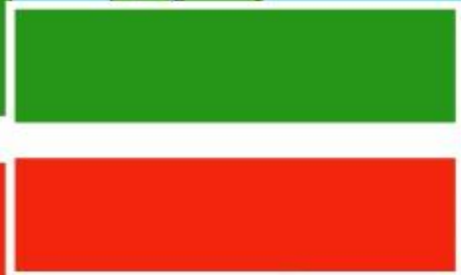
ФЛАГ РЕСПУБЛИКИ ТАТАРСТАН