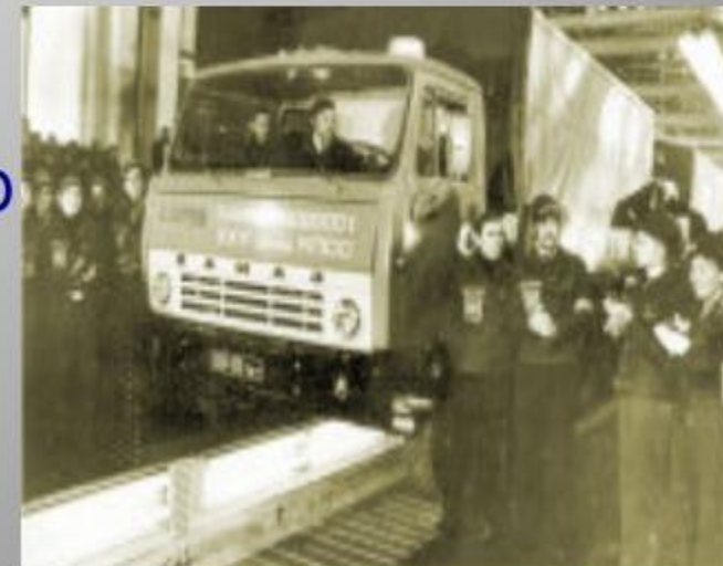
КАМАЗ 1976 г.