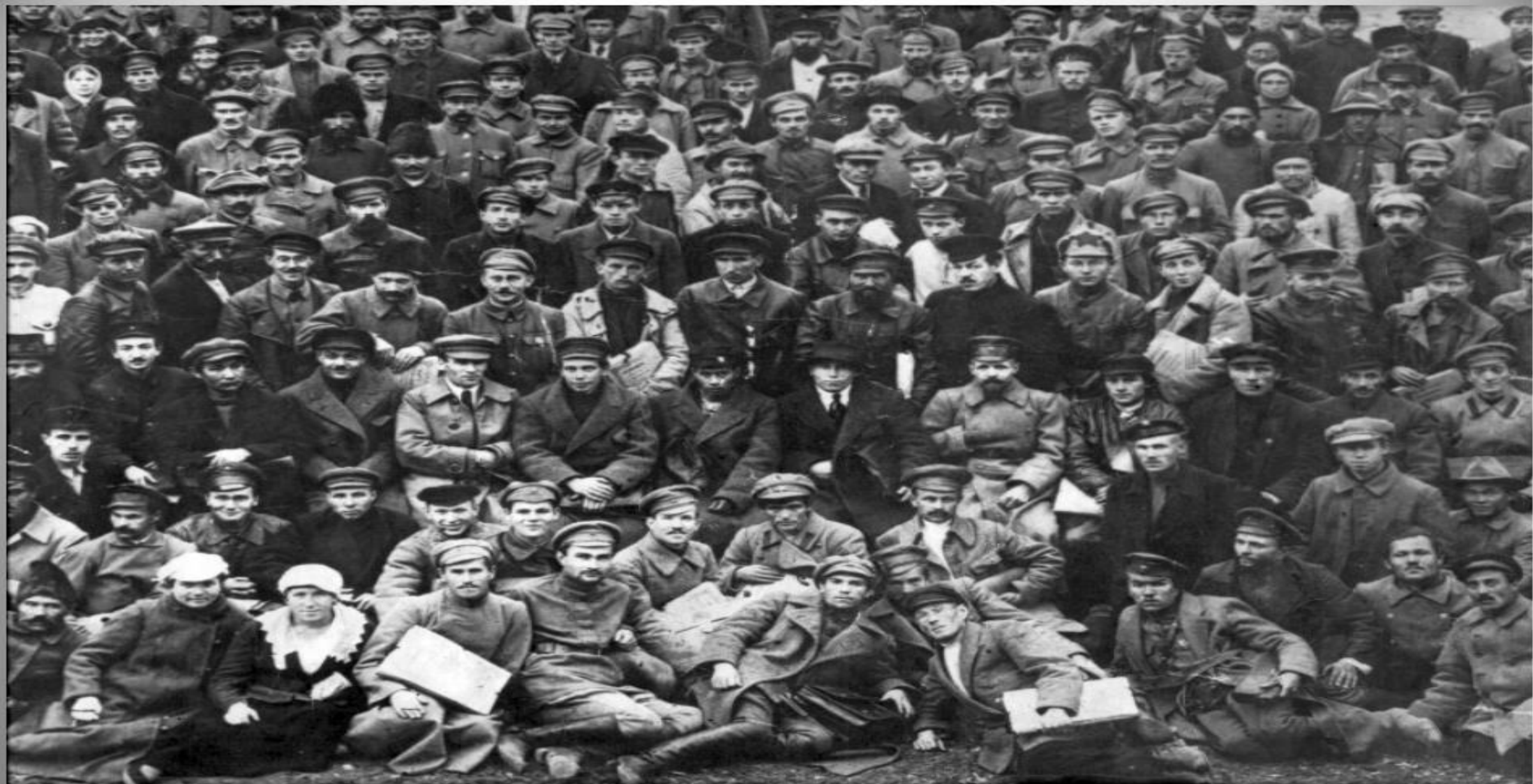
Учредительный съезд ТАССР 1920г.