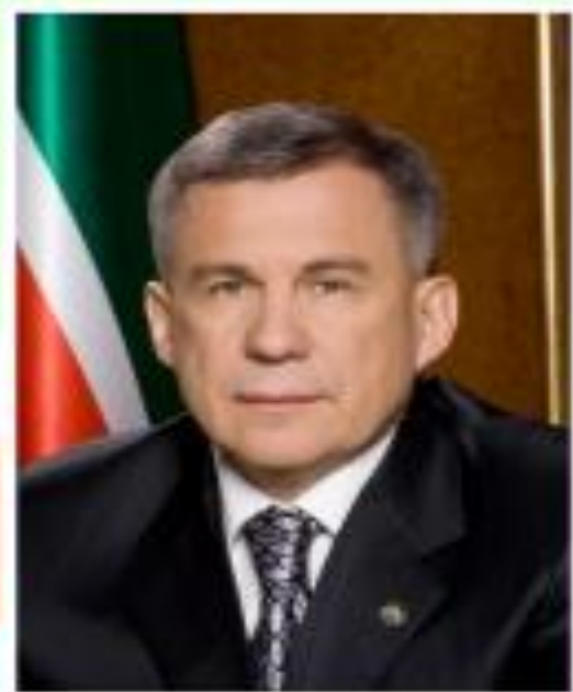
ПРЕЗИДЕНТ РЕСПУБЛИКИ ТАТАРСТАН