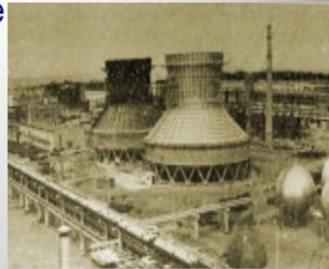
Нижнекамский нефтехимический комбинат 1961 г.

В послевоенный период на юго-востоке республики появился новый промышленный регион в связи с открытием и широкомасштабной разработкой здесь крупных месторождений нефти. Нефтяная отрасль значительно оживила и развитие химической промышленности в республике. Формирование Нижнекамского территориально-промышленного комплекса существенно изменило индустриальный облик республики.